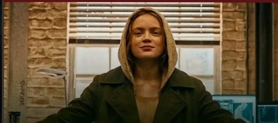
Imagem vazada dos sets de filmagens de Homem-Aranha: Um Novo Dia revelou o rosto da Jean Grey de Sadie Sink.

Tudo o que se sabe sobre o filme "Homem-Aranha: Um Novo Dia" da Marvel